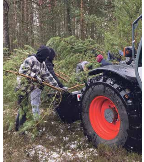
Dank enormer Manpower konnte eine riesige Fläche von jungem Gehölz befreit werden.

„Wir sind dankbar, dass wir hier im Camp so willkommen aufgenommen wurden. Deutschland ist nun unsere zweite Heimat, da freuen wir uns helfen zu können“, bekräftigten die Campbewohner. Den musikalischen Abschluss des Tages bereiteten die Jagdhornbläser des