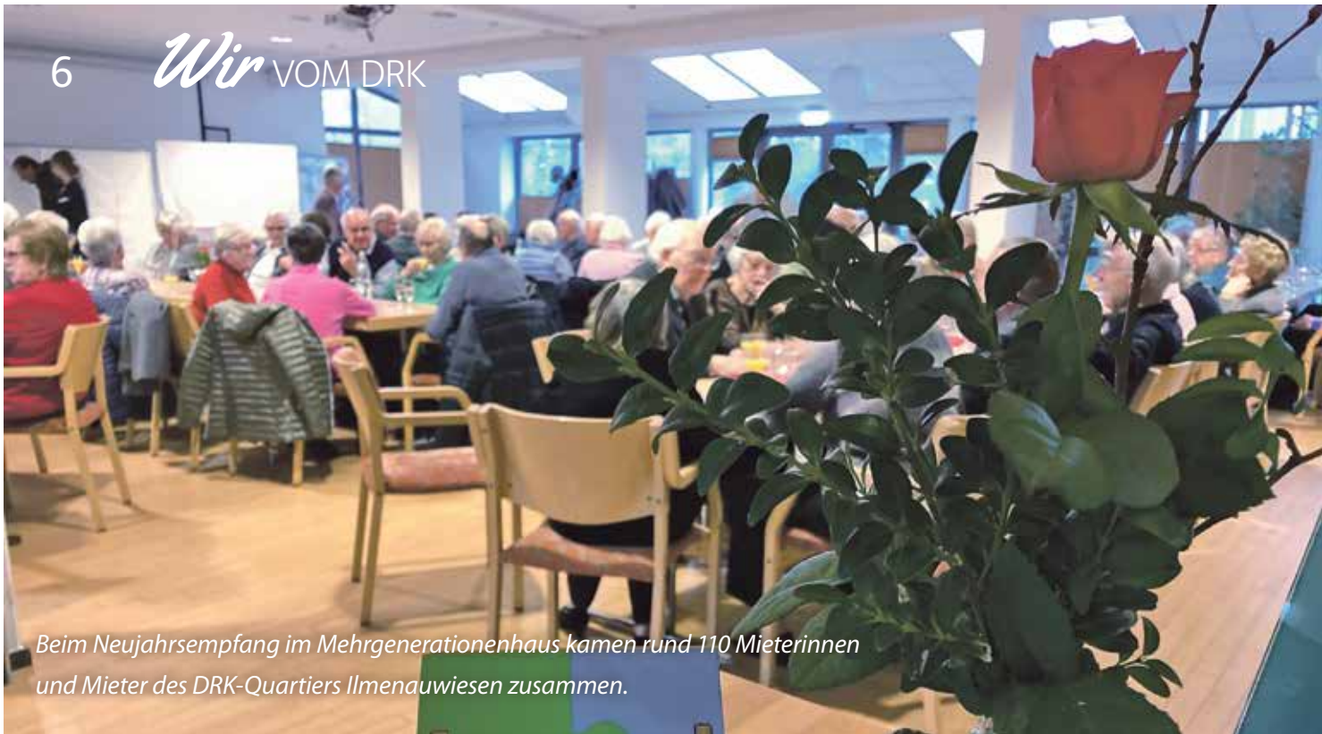
Beim Neujahrsempfang im Mehrgenerationenhaus kamen rund 110 Mieterinnen und Mieter des DRK-Quartiers Ilmenauwiesen zusammen.