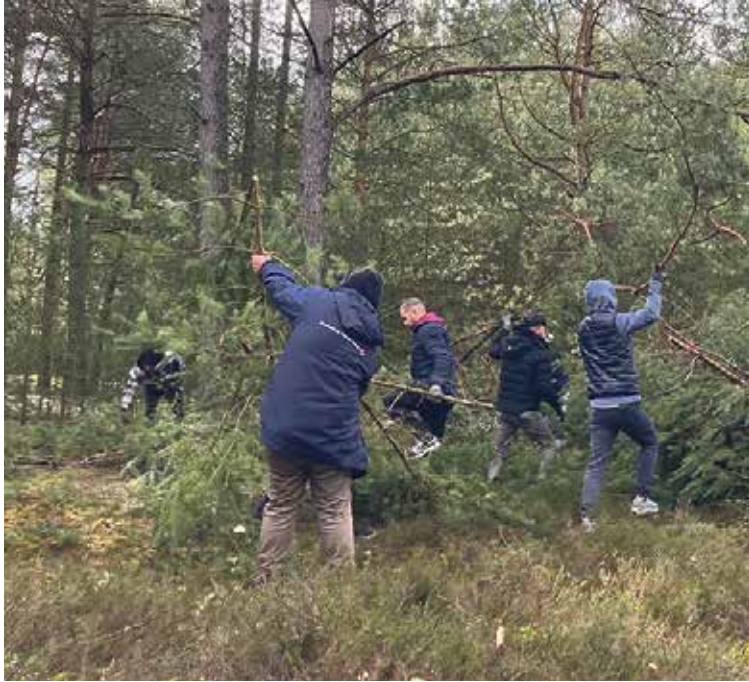
Rund 60 Campbewohner aus Afghanistan, Syrien und Irak halfen die Heide wieder flott zu machen.