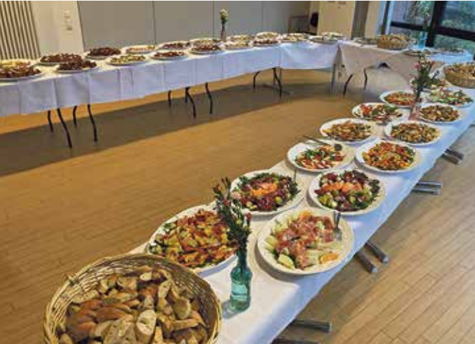
Das üppige Antipasti-Buffer schmeckte allen Gästen des DRK-Neujahrsempfang köstlich.

lichkeit ins Gespräch zu kommen, Gemeinsamkeiten zu erkennen, neue Bekanntschaften zu knüpfen und vielleicht sogar Freude daran zu finden, sich künftig auch füreinander zu engagieren.