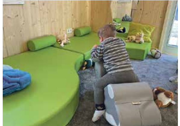
Die Gruppenräume sind hell und freundlich eingerichtet.