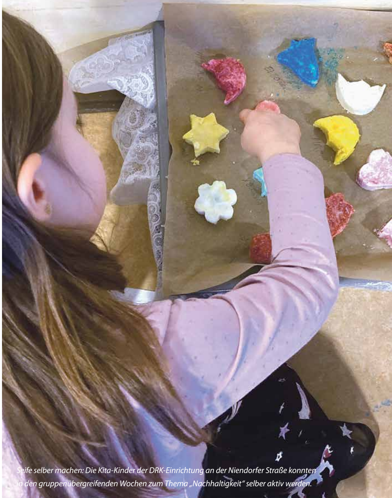
Seife selber machen: Die Kita-Kinder der DRK-Einrichtung an der Niendorfer Straße konnten in den gruppenübergreifenden Wochen zum Thema „Nachhaltigkeit“ selber aktiv werden.