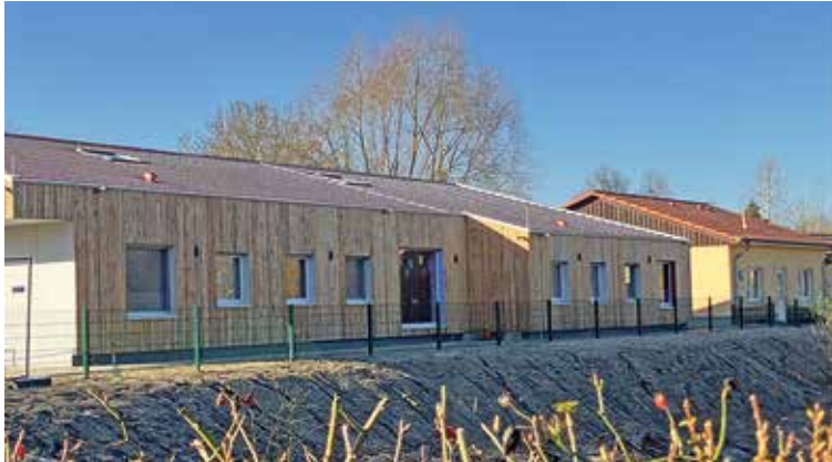
Das neue Gebäude grenzt unmittelbar an die vorhandenen Räumlichkeiten.

Ein langgehegter Wunsch ist in Erfüllung gegangen: Der Neubau der Krippe in Suderburg ist fertiggestellt. Mit Sack und Pack sind Krippenkinder aus dem alten in das neue Gebäude eingezogen.