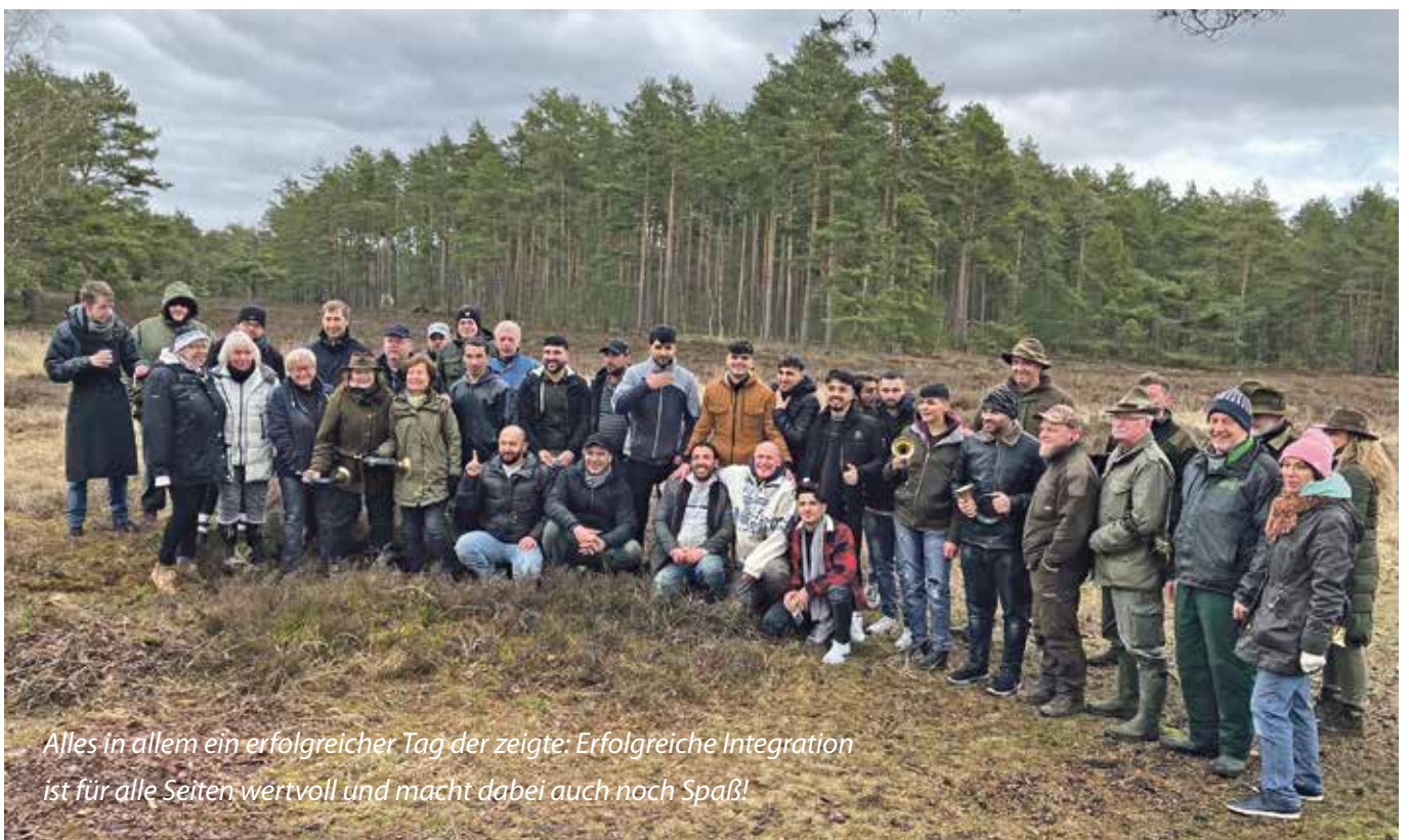
Alles in allem ein erfolgreicher Tag der zeigte: Erfolgreiche Integration ist für alle Seiten wertvoll und macht dabei auch noch Spaß!

Hegerings Bad Bodenteich mit traditionellen Liedern, deren Klang sich stimmig in die Heide-landschaft einfügte. Alles in allem ein erfolgreicher Tag der zeigte: Erfolgreiche Integration ist für alle Seiten wertvoll und macht dabei auch noch Spaß!