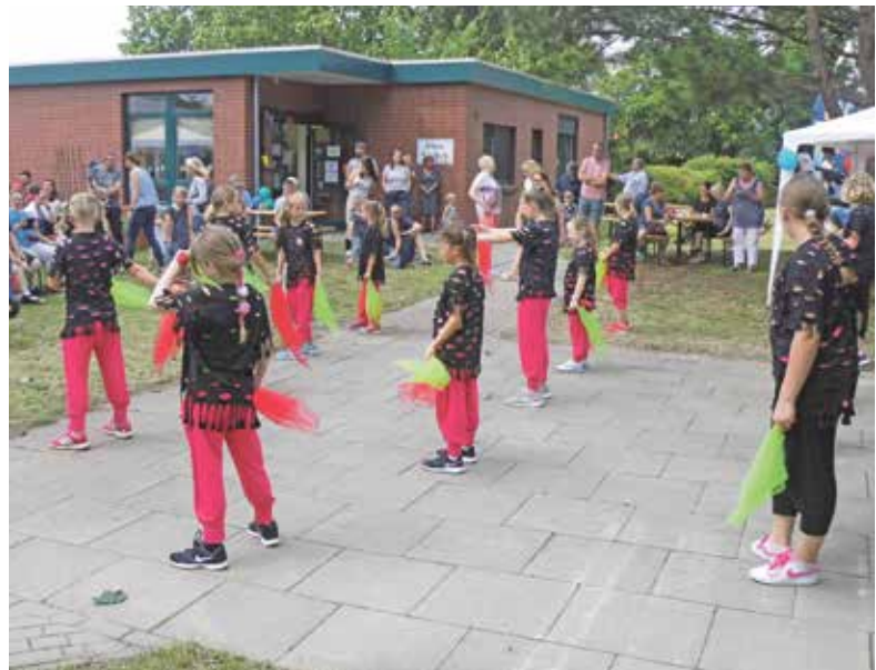
▶ Die Dance Kids begeisterten mit ihren Darbietungen.

Am Nachmittag hatten die Dance Kids ihren großen Auftritt. Sie begeisterten das Publikum mit ihrer Darbietung. Ein Dank geht an die vielen fleißigen Helfer und die vielen Spender, die das Fest unterstützten. ■