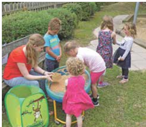
▲ Finde den Schatz.