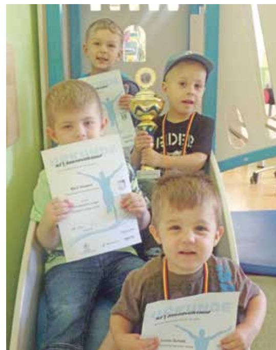
► Stolz wird der Pokal präsentiert.

Zum Abschluss der Siegerehrung wurde an alle Beteiligten eine Belohnung der besonderen Art verteilt: ein Riesen-Schokokuss. Schon jetzt freuen sich Kinder, Eltern und Mitarbeiterinnen auf die Teilnahme im nächsten Jahr! Denn dieses sportliche Ereignis ist fest in den Kalender des Kindergartens eingetragen. ■