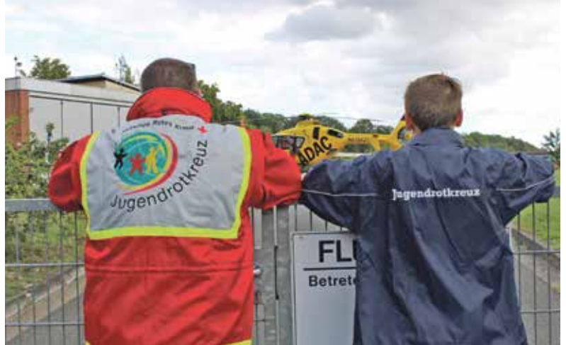
▲ Spannend: auch der ADAC Rettungshubschrauber wird besichtigt.

UELZEN Das Jugendrotkreuz (JRK) beim DRK-Kreisverband Uelzen stellt sich neu auf. An jedem Freitag um 17.30 Uhr finden die Gruppentreffen im Jugendrotkreuz-Raum im DRK-Seminarhaus an der Miesbacher Straße 2 in Uelzen statt. Alle interessierten Kinder ab sechs Jahren sind herzlich eingeladen. Mit Spiel und viel Spaß werden die Kinder an das Rote Kreuz herangeführt. Selbstverständlich steht Erste Hilfe auf dem Programm, denn Kinder und Jugendliche im Roten Kreuz können mehr, als nur ein Pflaster kleben. Aber Spiel und Spaß, basteln und kochen, backen, Wanderungen zum Eisessen stehen auf der Tagesordnung. Es werden Ret-