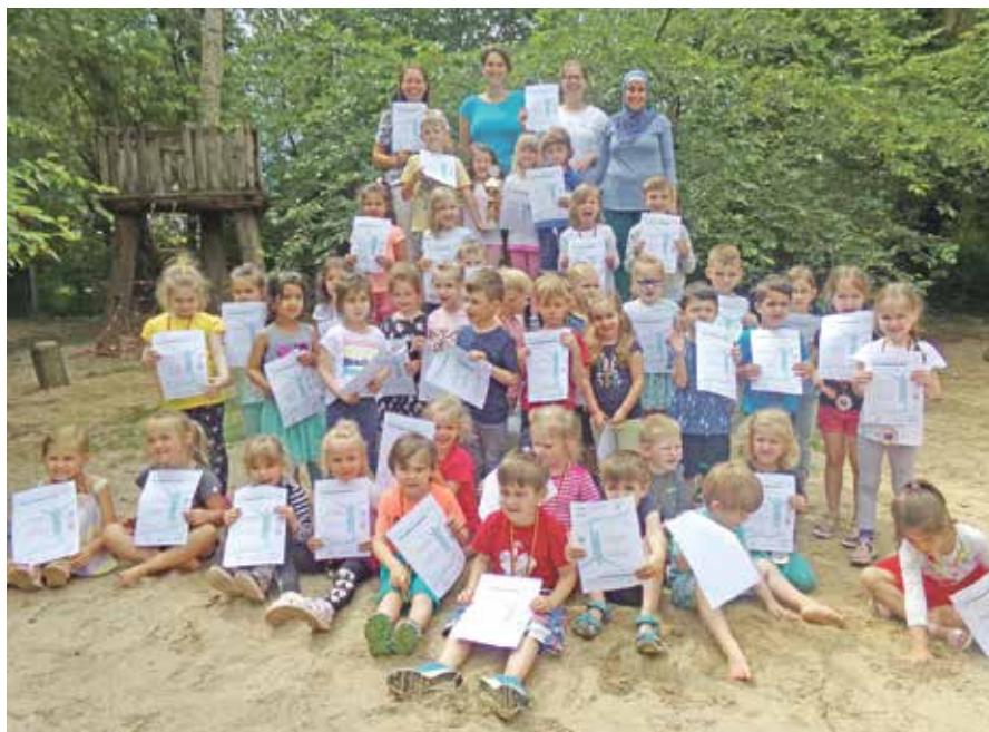
◀ So sehen Sieger aus.