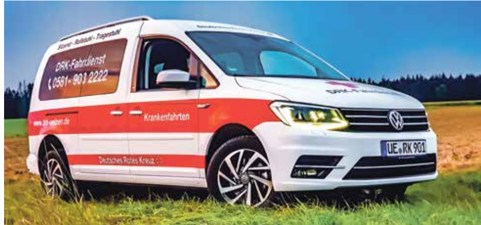
▲ Fahrten mit Tragestuhl und Rollstuhl sowie sitzend werden durchgeführt.

Die Fahrten erfolgen auf Anforderung durch den Arzt, die Abrechnung erfolgt über eine ärztliche Verordnung. „Nach Meinung der Kostenträger und nach einer