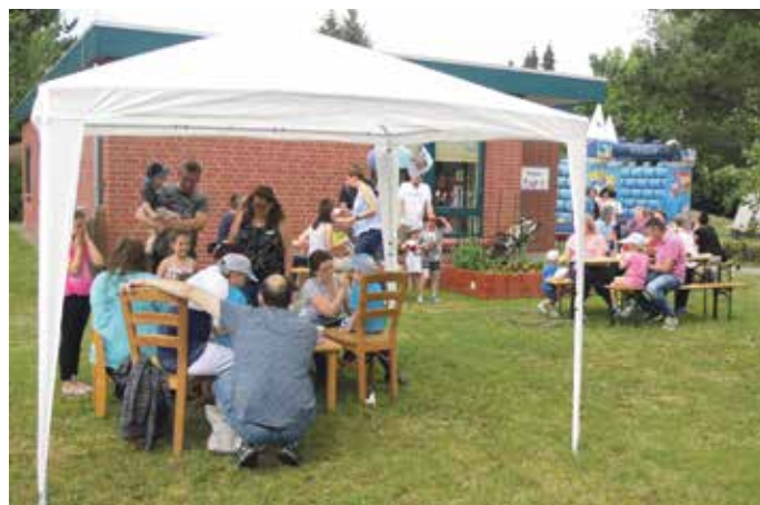
▶ Kinderschminken war beliebt.