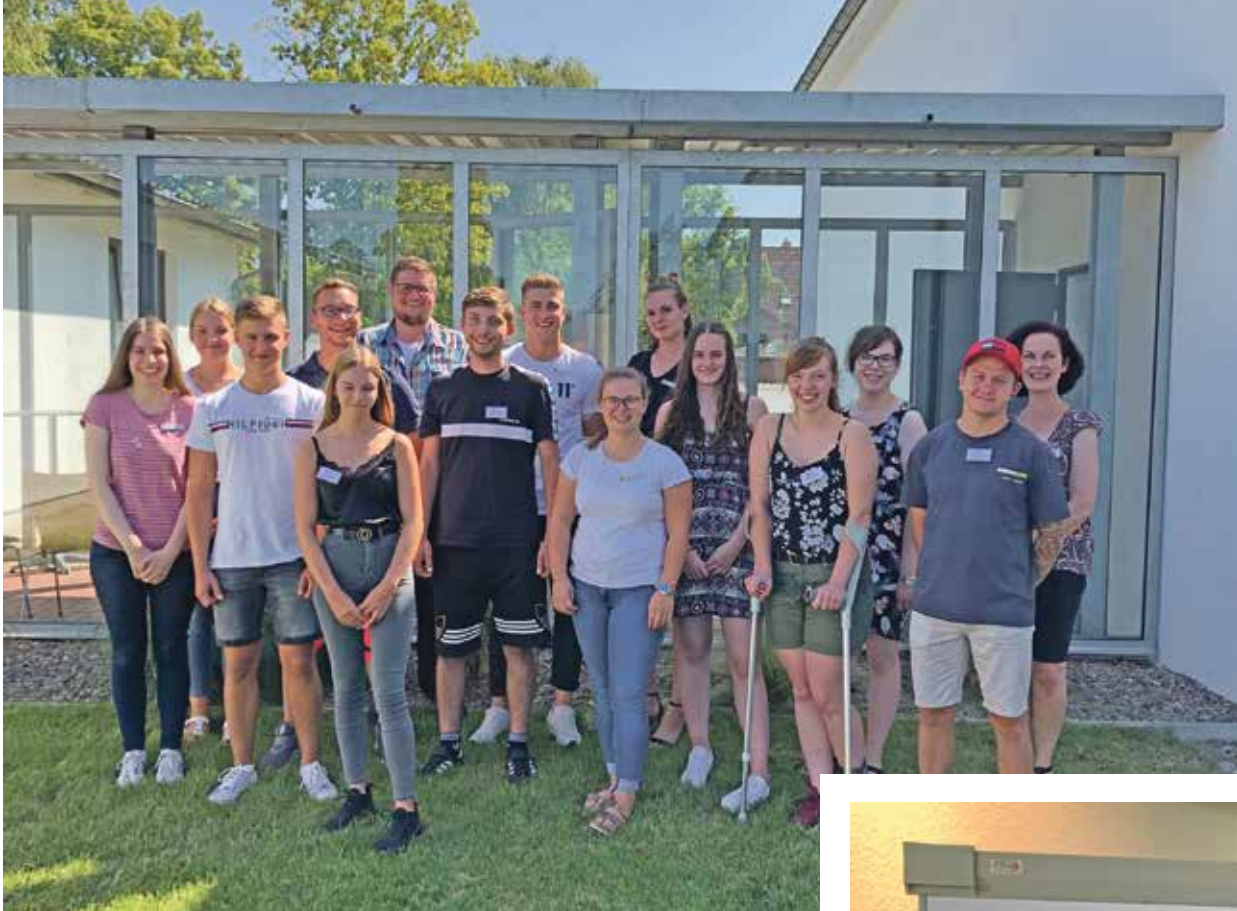
▲ Die Auszubildenden des DRK-Kreisverbands Uelzen.

Seit dem 1. August werden in den Bereichen Verwaltung, Rettungsdienst und Pflegedienst junge Menschen in den Berufen Kauffrau für Büromanagement, Notfallsanitäter, Fachkraft für Systemintegration sowie Pflegefachkraft ausgebildet. Bereits vor Ausbildungsstart gab es ein erstes Kennenlernen. Die „Neu-Azubis“ wurden von den „Alt-Azubis“ zu einem Azubi-Nachmittag eingeladen. Neben einer Präsentation über alle Bereiche der DRK-Arbeit gab es bei Pizza und Kuchen jede Menge Zeit, sich über den Alltag als Rotkreuzler auszutauschen. Der