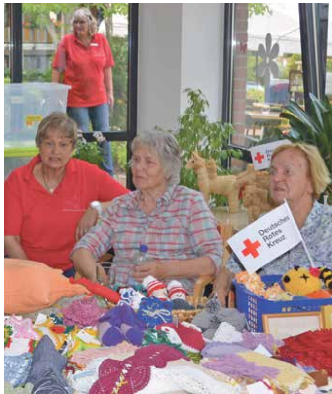
▶ Die Handarbeitsgruppe verkauft Selbstgefertigtes.

DRK-Hüpfburg, auf der fleißig getobt werden konnte. Das Team des MGZ ist glücklich mit den vielen Gesprächen und den positiven Rückmeldungen der rund 250 Besucher. „Wir danken allen Unterstützern und Ehrenamtlichen für die Mitgestaltung und Begeisterung rund um diesen Tag“, sagt Gundula Lindemann. ■