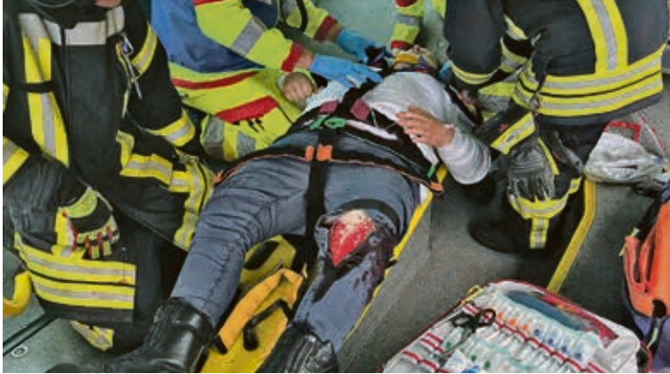
An dem Praxistag wurden in Zusammenarbeit mit der Freiwilligen Feuerwehr Bad Bodenteich verschiedene Fallbeispiele geübt