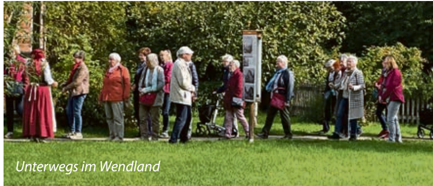
Unterwegs im Wendland

Nach einer Stärkung am Kartoffelbüfett im 1. Deutschen Kartoffel-Hotel, führte die Busfahrt durch die herbstliche Landschaft zum Arendsee.