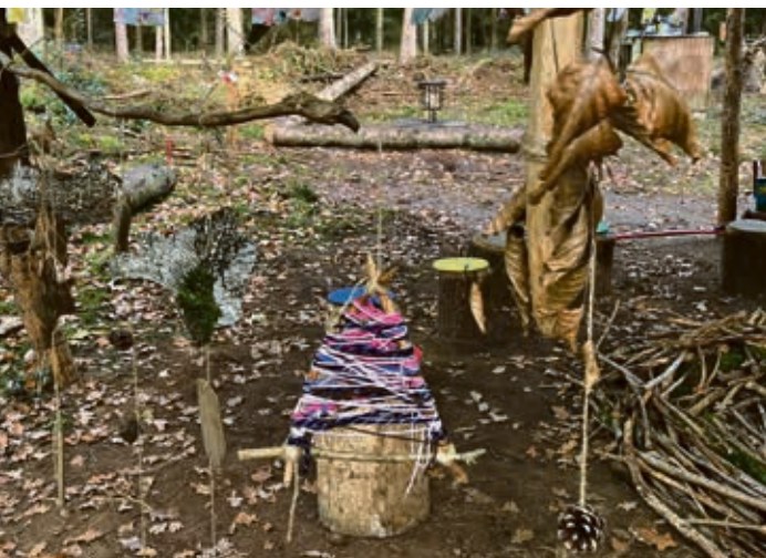
Dekoration aus Naturmaterialien

Unter dem großen Sonnensegel können alle in großer Runde beieinandersitzen. Ebenso im Bauwagen. Dort ist dann besonders gemütlich, wenn der Ofen angeheizt ist und eine schöne