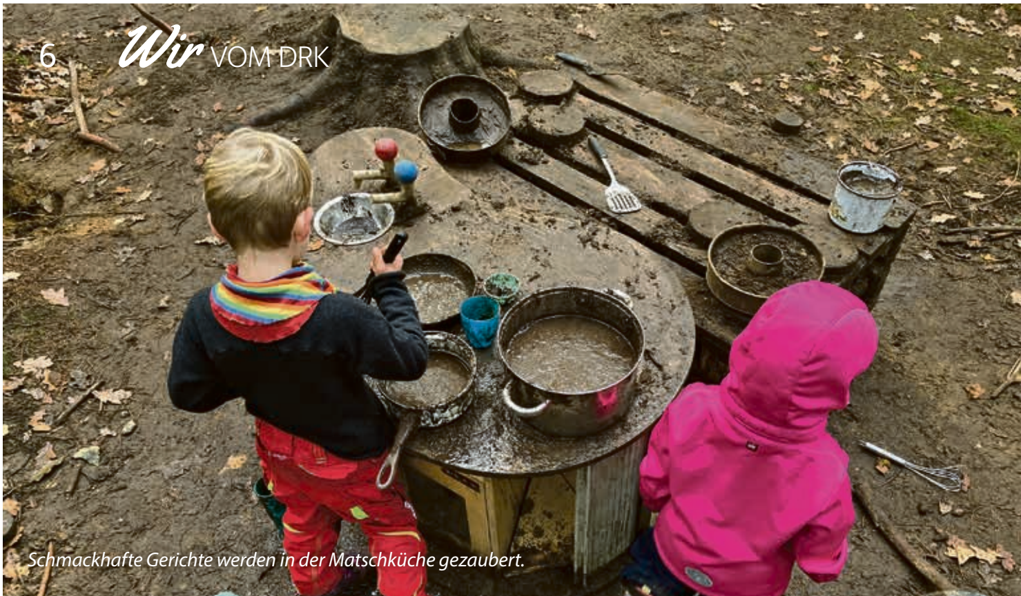
Schmackhafte Gerichte werden in der Matschküche gezaubert.