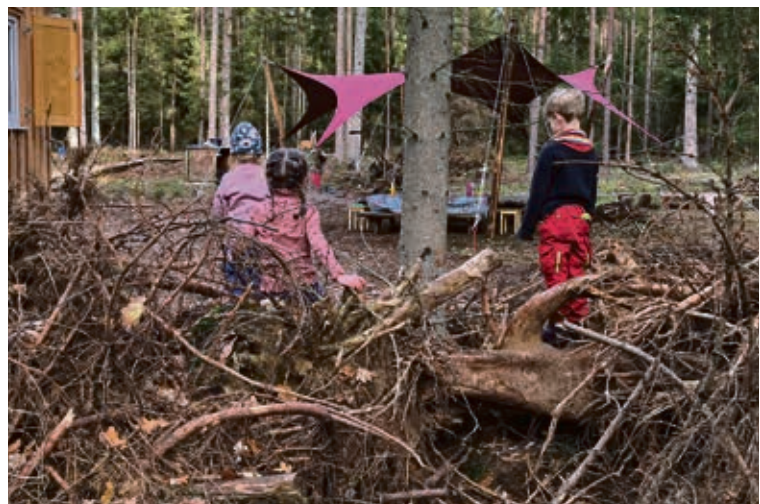
Eine große Baumwurzel dient als Klettergerüst

chenlange Vorbereitung sich gelohnt hat – sie hat es! Eine zu Beginn noch kleine Kindergruppe erlebt den Reichtum der hiesigen Wälder. Sie startet mit der Erforschung von Waldschätzen,