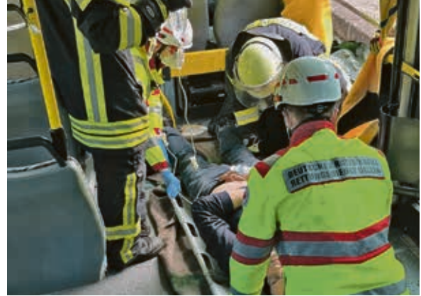
Ein wichtiger Bestandteil des Übungstages waren die lehrreichen Nachbesprechungen.

M itte Oktober wurden die Kräfte der Freiwilligen Feuerwehr Bad Bodenteich und der Rettungsdienst vom DRK Uelzen zu einem „Busunglück“ gerufen. Alle Beteiligten waren in diesem Fall sehr froh, dass es sich um eine Übung handelte. Organisiert wurde der Praxistag von der Feuerwehr Bad Bodenteich, auf deren Gelände das Busunglück inszeniert wurde.