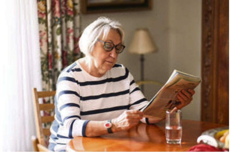
Der Hausnotruf gibt Sicherheit in den eigenen vier Wänden.