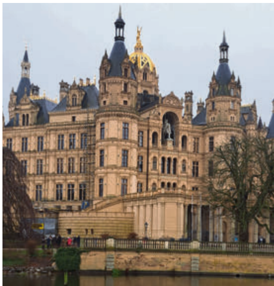
Das Schweriner Schloss war eines der Ausflugsziele im vergangenen Jahr.