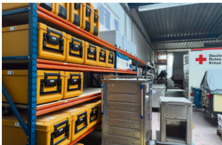
Auf etlichen Metern Regale wird Equipment für den Einsatzfall gelagert.

W ährend im früheren Verkaufs- und Beratungsraum noch fleißig gearbeitet wird, um Platz für das künftige Bürgerbüro der Samtgemeinde Bevensen-Ebstorf zu schaffen, präsentieren sich die angrenzenden Hallen bereits in einem völlig neuen Gewand. Hier hat der DRK-Kreisverband Uelzen einen neuen Standort für Fahrzeuge und Material des Bevölkerungs- und Katastrophenschutzes gefunden. Die bisherigen Lagerkapazitäten an der Miesbacher Straße in Uelzen waren erschöpft, so