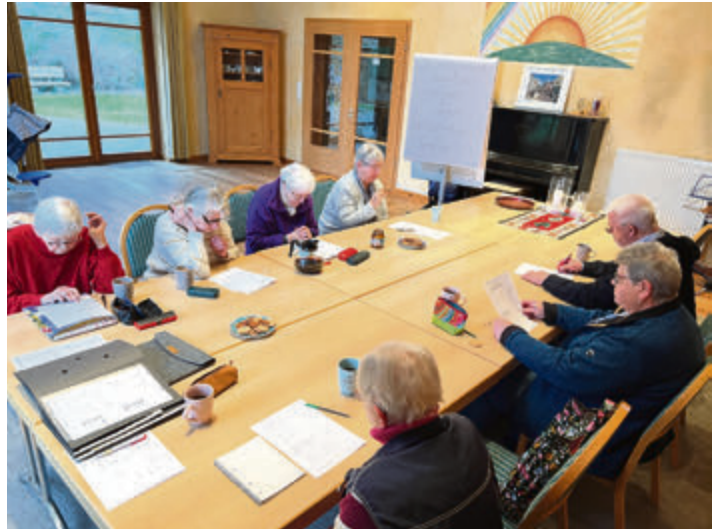
Einmal wöchentlich kommen die Donnerstags-Denker zusammen. Sie freuen sich über neue Mitstreiter.

Unser Angebot richtet sich an Menschen jeden Alters, die ihre geistigen Fähigkeiten erhalten und verbessern möchten sowie soziale Kontakte knüpfen möchten. Besonders ältere Menschen